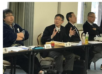
「組織担当者研修会の様子」

研修会では本部からの協議会組織状況や道教委主催研修会の状況などの報告をもとに、組織拡大に向けた課題について交流しました。